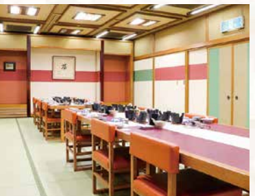
大宴会場(100畳)の他 中宴会場(60畳)・小宴会場(30畳)