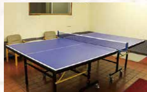
卓球・麻雀・カラオケ