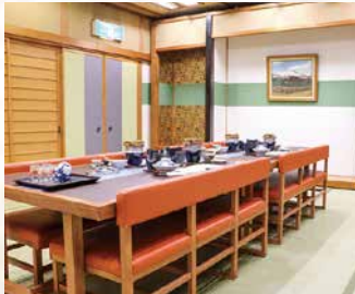
個室お食事処もございます。