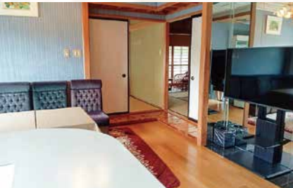
【特別室】和室2間+リビングルームの103㎡